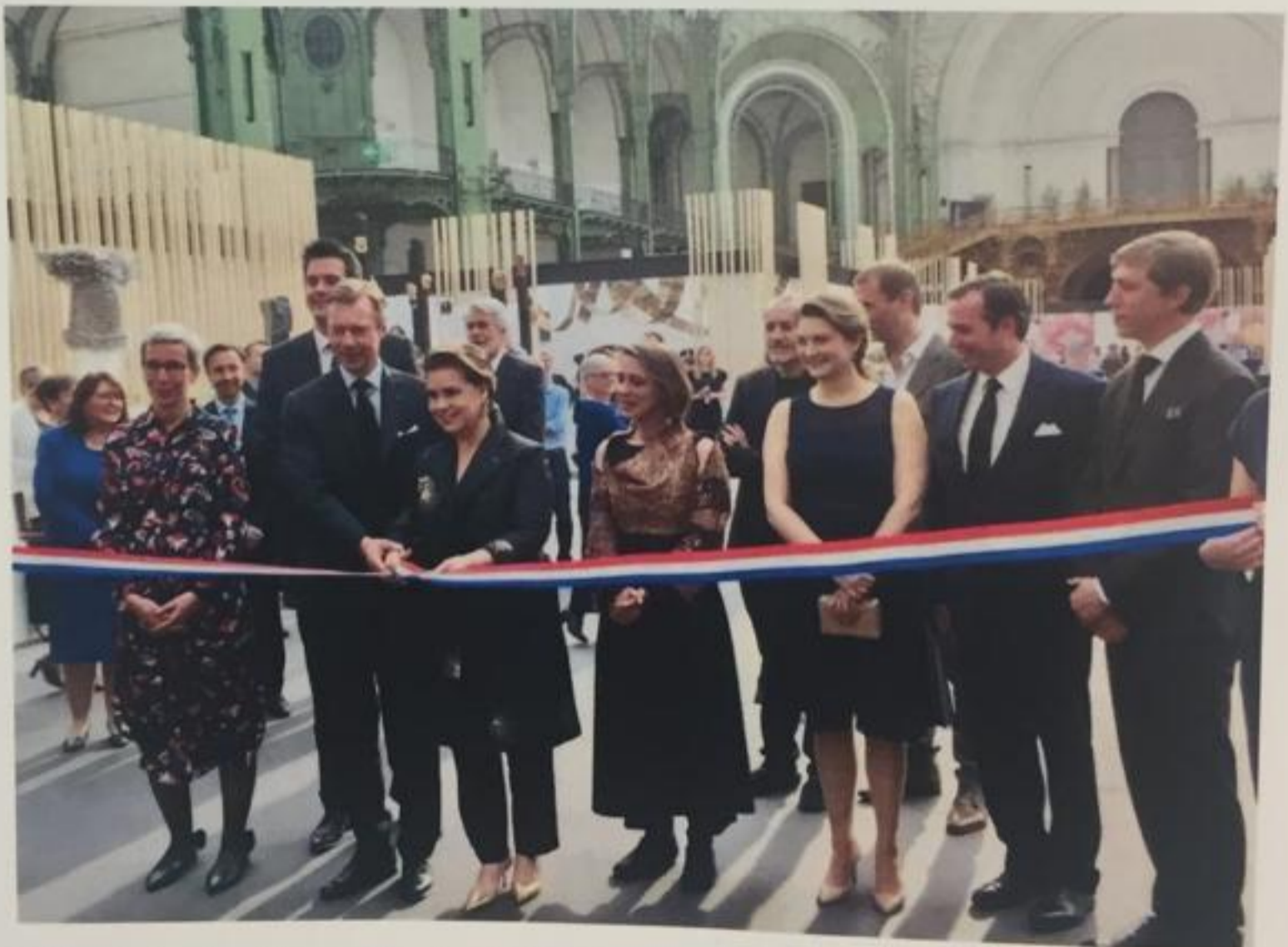
Cérémonie du ruban à l'inauguration du salon Révélations