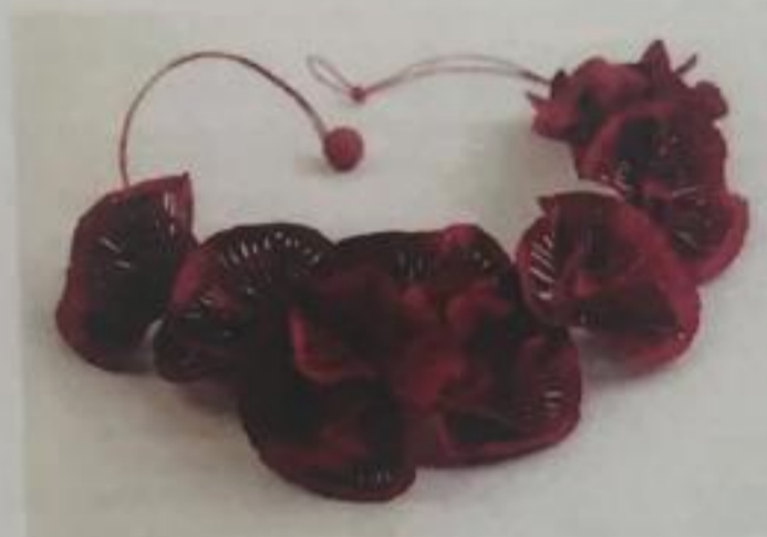
Ana Hagopian, collier Œillet sur papier découpé au laser.

Quatrième saison pour la biennale Révélations qui entend imposer les métiers d'art sur la scène de l'art contemporain. L'événement parisien déploie ses ambitions à l'international à travers une sélection éclectique de qualité.